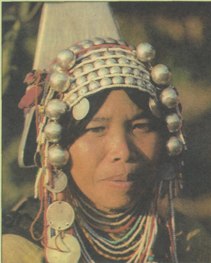
Žena iz plemena Akha

V prostoru se pojavita še dve temni senci, ki se poležeta po škripajočem podu. Prvi mož se neslišno umakne in prepusti pipo naslednjemu. Kolobarji dima postajajo vse bolj beli, včasih skoraj taki kot belina dneva. Vrtinčasti sij privleče na dan vse mogoče privide in nepojasnjene zaznave. Privleče ti na dan ne-