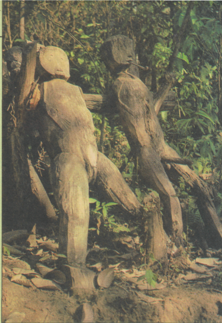
Animistična simbola sta prvi znak, da smo pred vasjo

pritisk s svojim velikim aparatom na domačine. To je vneslo strah in negotovost pri nekaterih gorskih plemenih, pred vsem pri tistih, ki živijo skoraj izključno od gojenja opija. Večna napetost in strah pred kontrolami in racijami osebja in agentov od protiopijskega združenja je sprožila splošno nezaupljivost